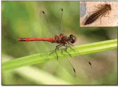
Luďk. 2010, 1004